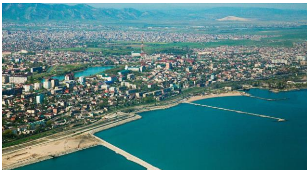
نمایی از شهر ماخاچکالا